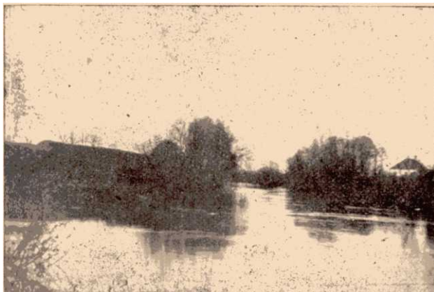
Lapincs és a Rába összefolyása. Az „Ifjúság és Élet” c. folyóirathól.

Rábafüzesen van a Rigó-patak (Amselbach) és a Lam-patak 22 .