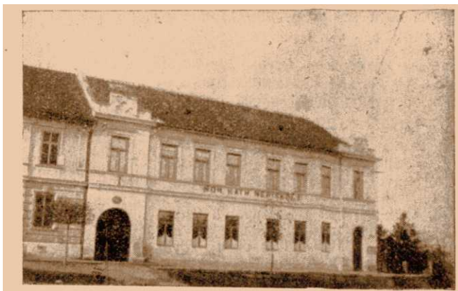
Róm. kat. népiskola.

Mikor 1878-ban a magyar származású ciszterciek vezetése alá került az apátság, hazafias szellem költözött be az iskolába is, jóllehet kezdetben a magyarosítási törekvés nagy ellenszenvre talált a lakosságban s nem egy szülő e miatt ki is vette gyermekét az iskolából. A hazafias szellemű ciszterci papok és világi tanítók azonban nem törődtek a szülők zúgolódásával, hanem a már megkezdett úton haladtak és munkásságukat nagy siker is koronázta, úgyhogy az 1879—80. iskolai évben már minden tantárgyat magyarul taníthattak.