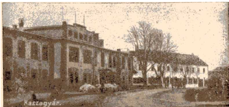
Kaszagyár. Dezső Lipót „Az én szülőföldem” c. művéből

Ebben a terjedelmes gyárban készül a magyar kasza, amelynek előállításához a sok munkáskézen kívül sok gép is szükséges. A gyár igazgatósági engedéllyel megtekinthető.