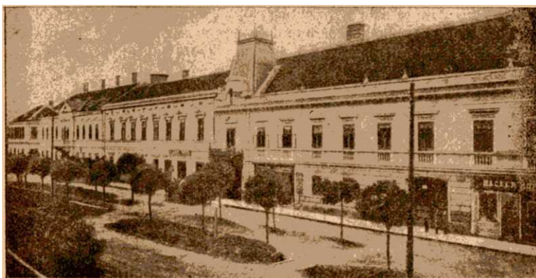
Kossuth Lajos-utca. Dezső Lipót „Az én szülőföldem” c. művéből.

A Korona-szálló előtti téren a Kossuth Lajos-utca, Széchenyi-utca, Széll Kálmán-tér és az Árpád-utca kereszteződnek.