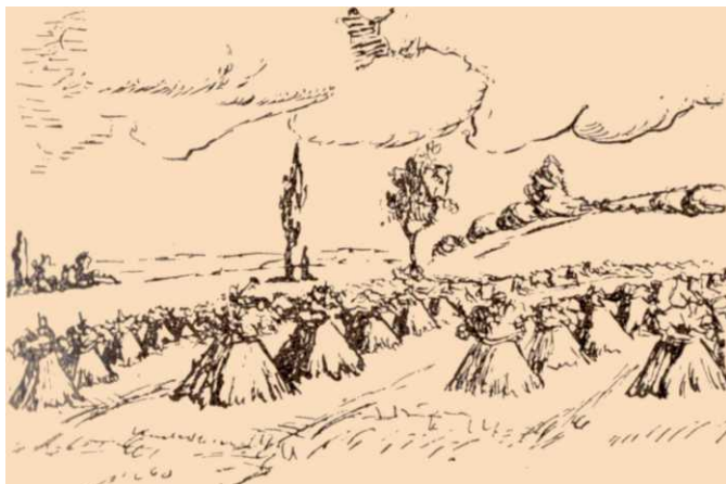
Hajdinagubók vagy hajdinakévék. Az „Ifjúság és Élet” c. folyóiratból.

A mezőn számtalan gyógynövény tenyészik. Szentgotthárdnak és környékének két speciális, ú. n. helyi, gazdasági növényéről azonban nem szabad elfeledkeznünk. Ezek egyike a hajdina, amely pohánka, hricska, kruppa, tatárka, a szegény ember búzája néven is ismeretes és amelyet tarló után vetnek és szeptember hóban aratnak. A gazda a hajdina magvát megőrölve lisztnek, meghántolva pedig kásának használja.