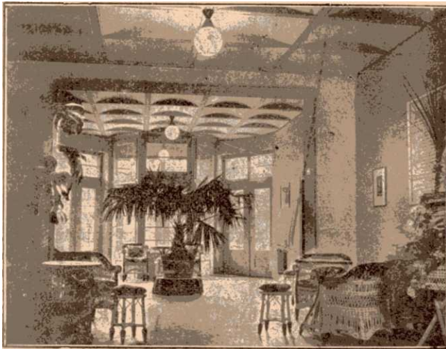
z iskolaszanatórium előcsarnoka.

Magyar Iskolaszanatórium. — Az iskolaszanatóriumot, amely nemcsak Magyarországnak, de szinte egész Európának páratlan intézete, 1930 júniusában avatták fel és adták át nemes rendeltetésének: a gyermek beteg szervezetének gyógyítására és lelkének kiművelésére. Ez az intézet tehát: gyógyít és tanít.