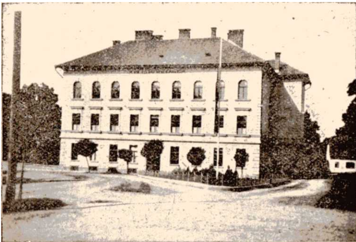
Reálgimnázium épülete. Az „Ifjúság és Élet” c. folyóiratból.