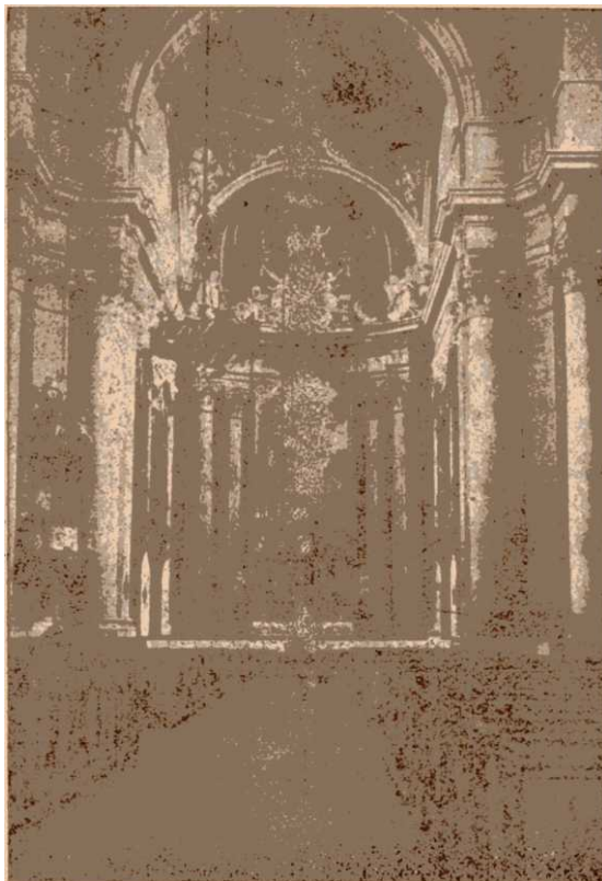
Az apátsági templom belseje. Dezső Lipót „Az én szülőföldem” c. művéből.

A főbejárat felett levő nagy kóruson találjuk a pár éve javított hatalmas orgonát és a művészi faragványokkal ékeskedő 20 szerzetesi karszéket, ú. n. stallumot.