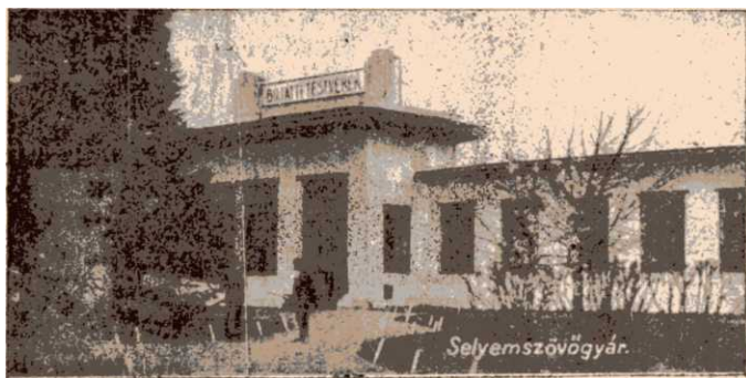
Selyemgyár. Dezső Lipót „Az én szülőföldem” c. művéből.

A selyemgyárat Löbl Mátyás bécsi lakos kezdeményezésére a Bujatti-Testvérek 1900-ban alapították; e gyár 1912-ben „Magyar Selyemipar Részvénytársaság, ezelőtt Bujatti-Testvérek” címen részvénytársasággá alakult s azóta is e néven szerepel.