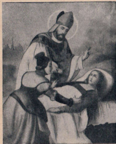
Szent Gotthárd, hildesheimi püspök

A SZENTGOTTHÁRDI KAT. EGYHÁZKÖZSÉG KIADÁSA