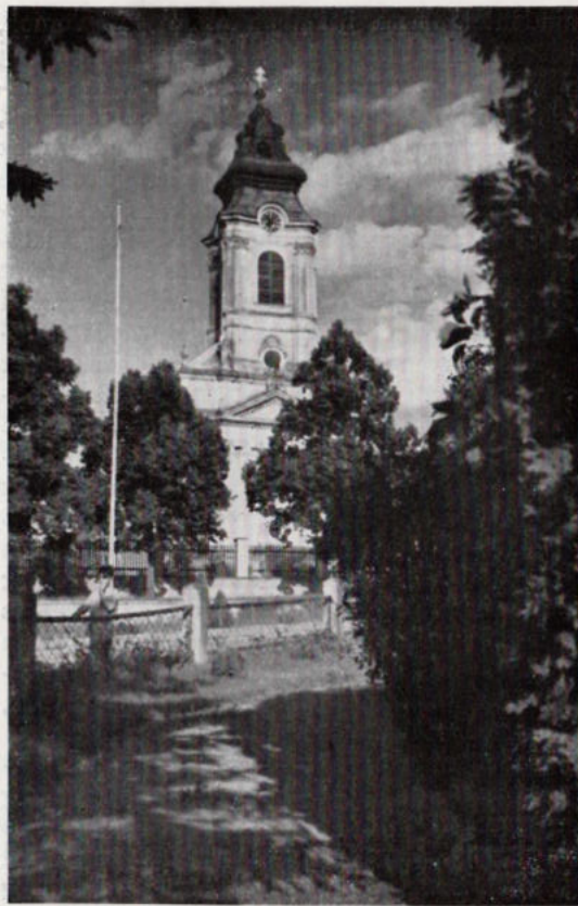
Az apátsági templom barokk-tornya.

Azóta tizennégy év telt el hullámzó történelmi eseményekkel. Így jött el 1938, az az esztendő, amely nemcsak a benne élő generáció számára lesz feledhetetlen, hanem nemzedékek hosszú sora is büszkén tekint majd vissza ennek alkotásaira. Érthető is. Ez az eucharisztikus év a világ középpontjává tett bennünket a szó igazi valódi értelmében. Öt világrész 406 millió katolikusa tekint ránk és emlegeti nevünket. Megszámlálhatatlan nyelven megszámlálhatatlan újságcikk foglalkozik velünk. Félelmetesen belekerültünk a világerdeklődés reflektorának fénycsóvjába. Jóllehet az Eucharisztia vallási életünk és imádásunk tárgya és középpontja, amely lelki életet táplál és nem politikát mozgat, az isteni Mester azonban mégis az Eucharisztia fehérsége mellett mutat meg bennünket a világnak, talán hogy megalázottságunk és elhagyatottságunk fájó sebére balzsamot csepegtessen. De 1938 nemzeti jubileumunk is. Szent István halálának 900 éves fordulója. Ez az ölelkező kettős szentév teremt most nálunk évszázadok számára maradandó emlékeket. Ezért épülnek