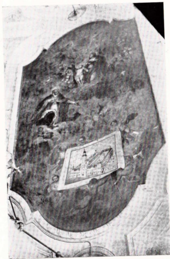
Az Apátság refektóriumának mennyezetképe.

A szent püspök alakjának másik ábrázolása a templom Szent Gotthárd-oltárának oltárképe. Történeti elbeszélő kép zsúfolt történelmi jelenetekkel a Szent életéből. Formája fönt kerek, alul szögletes, ú. n. dómszerű magas idom. A kép felső részén gomolygó, fényes felhőn jelenik meg Szent Gotthárd, arcán az üdvözültek csodás nyugalma és derűje. Mintha végigtekintene a részint életében, részint holta után történt csodáin. A felső rész baloldali fele azt a jelenetet ábrázolja, midőn Szent Gotthárd a katedrálisban az oltártól ünnepélyes méltósággal felszólítja az exkommunikáltakat a szent helyről való távozásra. A felszólításra a templom kriptájában pihenő kiközösítetten meghaltak is felkelnek sírjukból és alázatos engedelmisséggel indulnak ki a templomból. Ez az esemény mind irodalmilag, mind festészetileg ismert. Festészeti megoldásában Gusner nem törekszik ere-