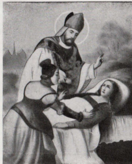
Szent Gotthárd, hildesheimi püspök

A SZENTGOTTHÁRDI KAT. EGYHÁZKÖZSÉG KIADÁSA