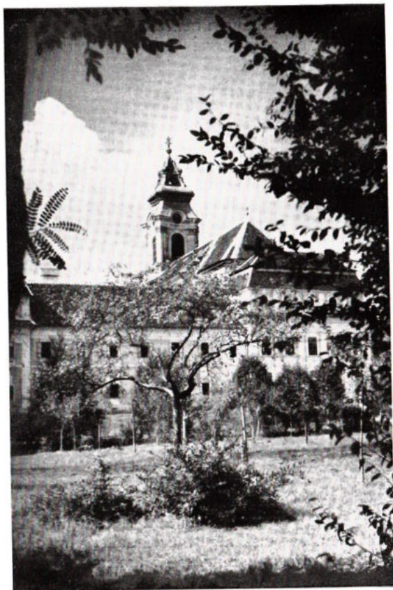
Az Apátság keleti oldala.

Más vélemény, mely szintén tudományos érvekre építi elgondolását, nem fogadja el a