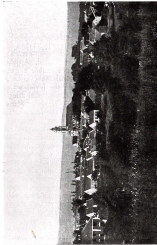
Szentgotthárd madártávlati képe.

ban a Szent Gotthárd-kultúrház alapjának a megvetéséről és az új Szent Gotthárd-harangok megszerzéséről. Itt említjük meg azt is, hogy a katolikus egyházközség kiadásában, a város támogatásával megjelenő Emlékfüzet mellett a plébánia egy Szent Gotthárd-litániát ad hívei kezébe a püspök képével, amely litániának az a rendeltetése, hogy a város védőszentje iránt való tiszteletet, szeretetet és ragaszkodást felgerjessze és ápolja.