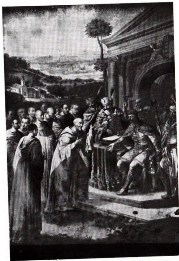
Dorfmeister : III. Béla királyunk, az Apátság alapítója, az első 13 francia ciszt. szerzetessel.

A németújvári bencések ily módon mind a templomnak, mind a községnek már eldöntötték a nevét, amidőn a XII. század vége felé a ciszterciek itt letelepedtek. A németújvári bencés apátság ugyanis igen rövid életű volt, mert amikor III. Béla királyunk háborús viszályba keveredett a szomszédos Ausztriával és emiatt biztosítania kellett a nyugati határokat, a németújvári monostor-hegyet várrá alakította át. A bencések távozásával azonban pásztor nélkül maradt a nyáj, lelkipásztorok nélkül az egész vidék. De ez az állapot sehogysem felelt meg III. Béla nagyvonalú kultúrpolitikai tervei- nek és a nyugati határvidék erőteljesebb kultúr- igényének, azért a király más formában kívánt gondoskodni a jogos igények kielégítéséről. A francia királyleánnyal kötött második házasa- ga bizonyos fokú francia orientációt hozott magával. A rokoni kapcsolatok baráti össze- kötötést alapoznak meg a két nemzet között és